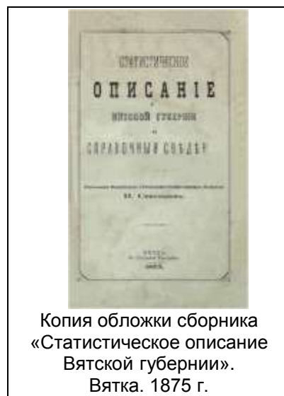
Копия обложки сборника «Статистическое описание Вятской губернии». Вятка. 1875 г.

В 1880 - 1881 гг. в честь столетия основания Вятской губернии под редакцией Н. А. Спасского вышел двухтомник «Столетие Вятской губернии с 1780 по 1880 годы, сборник материалов к истории Вятского края» и приложение к нему под названием «Древние акты, относящиеся к истории Вятского края». Это издание, представленное Вятским губернатором Николаем Александровичем Тройницким в Центральный статистический комитет, получило высокую оценку в правительственных кругах. Вскоре Н. А. Тройницкий (действительный статский советник, статистик, возглавлял Вятский губернский статистический