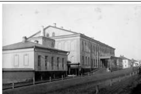
Здание окружного суда. Вятка, ул. Спасская. Фото 1890-х гг., флигели ещё не надстроены и не соединены с домом. В этом здании в 1835 - 1855 гг. размещался Вятский губернский статистический комитет

Новый этап в развитии административной статистики в губернии наступил после введения нового, Высочайше утверждённого 26 декабря 1860 г., «Положения о губернских статистических комитетах», в котором определены