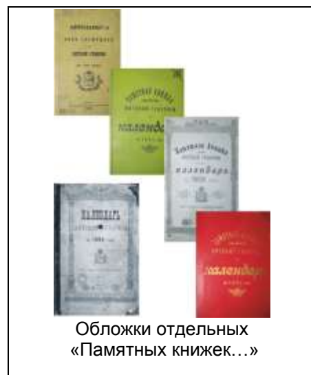
Обложки отдельных «Памятных книжек...»

На рубеже XIX - XX вв. начали зарождаться отраслевые статистики: сельскохозяйственная, промышленная, железнодорожного транспорта, торговли, труда, бюджетная статистика и статистика населения. В этот период организовано и проведено много крупных разработок, среди которых Первая рос-