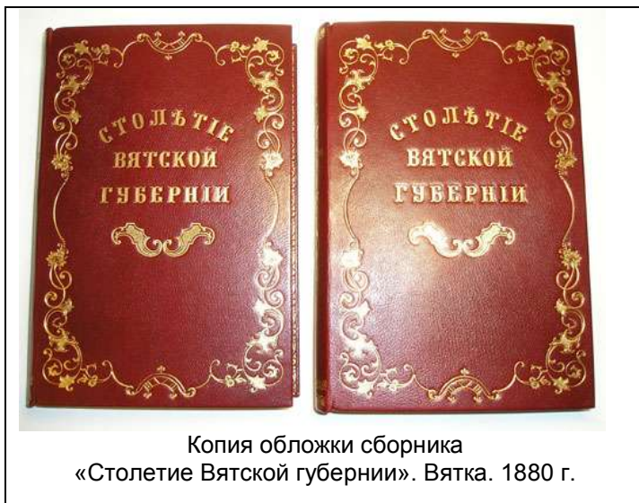
Копия обложки сборника «Столетие Вятской губернии». Вятка. 1880 г.

комитет в 1876 - 1882 гг.) был назначен на пост председателя Центрального статистического комитета, и возглавлял его 20 лет.