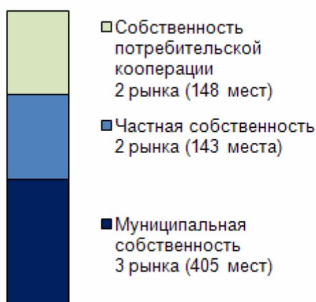
Распределение рынков по форме собственности